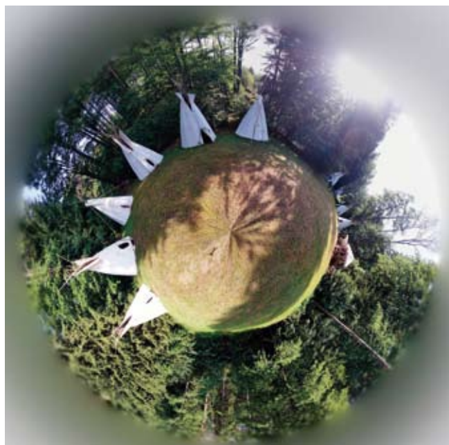
Česká Lípa