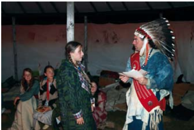
Z tábora kmene Walden na Kosím potoce, 2019 (udílení orlích per)

Někdy učiníme rozhodnutí o tématu jen v představenstvu. Když cítím oporu, beru někdy rozhodnutí o vyjádření k tématu na sebe – a pak samozřejmě riskuji a jdu s kůží na trh. A jestli jsem někdy šlápl vedle? Ano, jednou určitě. Valné shromáždění pak přijalo usnesení a vyčetlo mi, že jsem nedostatečně hájil zájmy části našich členů. Snad jsem si to odpracoval, protože mě pak zvolili znovu za předsedu ☺