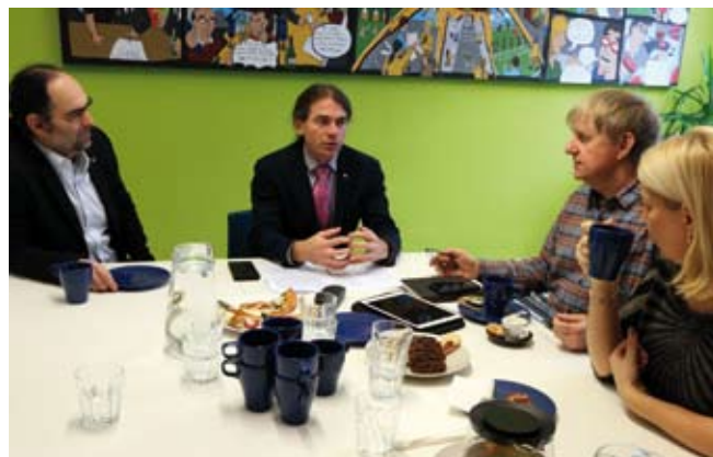
Při debatě se zástupci členských organizací ČRDM, leden 2020

Zajímavé je sledovat i změnu života vedoucích. Vidím to na sobě. Najednou mohu být o víkend doma s rodinou – a teď, nevídáno, ani nikam nejedeme. Jdeme jen na procházku po okolí. Už ani nepamatuji, kdy jsme měli na sebe tolik času. Toho času, který bych trávil s oddílem na našem tábořišti, na vzdělávacích kurzech nebo na jiných pracích pro naši organizaci. Myslím, že i mnohým dalším vedoucím bude proti srsti se skokově opřít do tempa, v němž jeli, než přišla doba covidová.