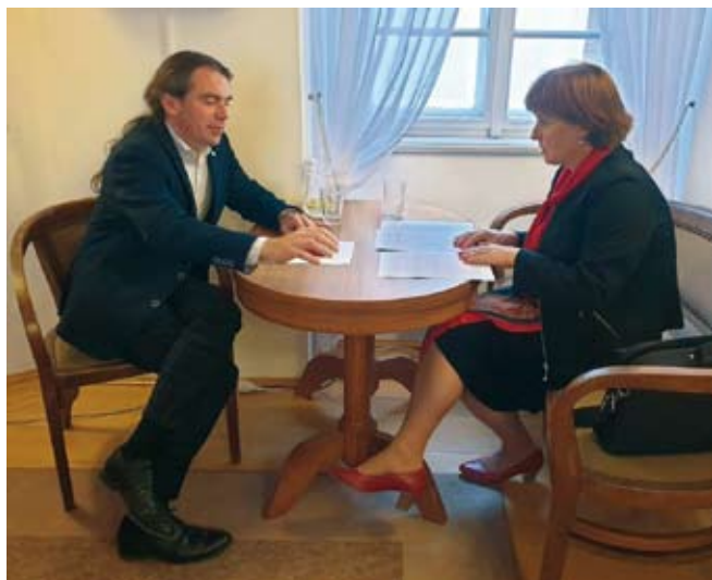
Aleš Sedláček s hlavní hygieničkou ČR Jarmilou Rázovou objasňují a upřesňují sporné výklady Manuálu k táborům 2020, červen 2020

Na tomhle pojmu je úžasné to, že nikdo přesně neví, co nebo kdo by to měl být. Většinou se s ním setkávám v negativní konotaci, to když chce někdo ukázat na viníka, na nikým nevolené entity, které mají za cíl měnit chod společnosti a činí tak na jakousi skrytou objednávku. Hodnoty, které přinášejí, jsou pak ztělesněným zlem, které rozsévají do naší tradiční vyspělé společnosti, kterou se tím snaží rozvrátit. Myslím, že je to hlavně jakési klišé, jež dává možnost ulevit si a hledat vinu někde venku. Smutné je, že se v tomto přístupu k životu vytrácí nejen osobní odpovědnost za stav věci, ale i odvaha a odhodlání cokoli měnit. Přeci to nemá cenu, když jsou tady ti, co všechno řídí, a já jsem jen kolečko v soukolí, loutka v divadle mocných.