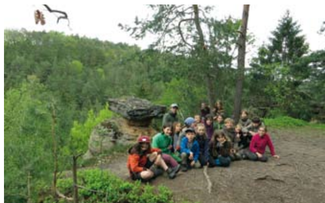
Výprava dětských členů kmene Walden na Kokořínsko, 2019