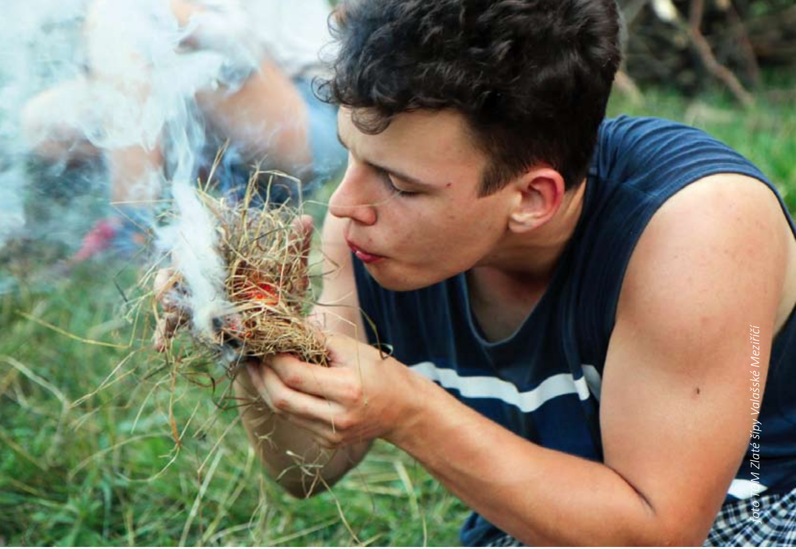
Zlaté šipy Valašské Meziříčí